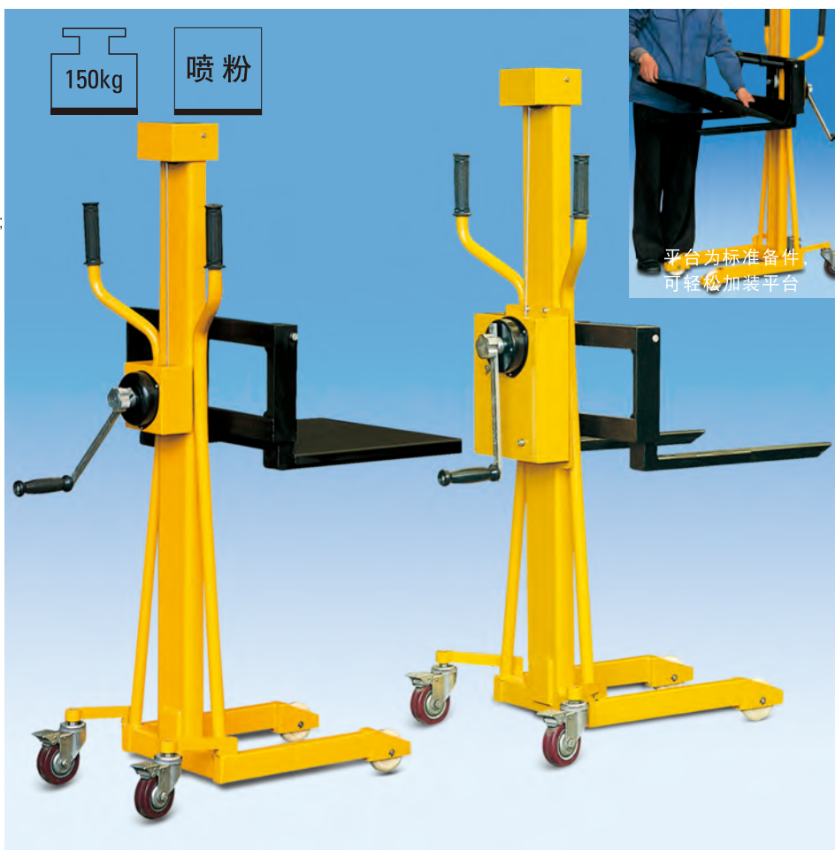
平台为标准备件 可轻松加装平台