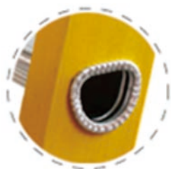
高强度铝合金D型铆接工艺