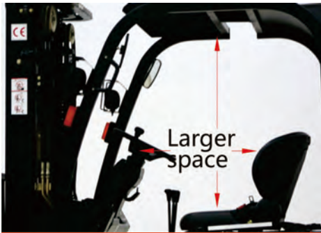
根据人机工程学空间尺寸设计的超大驾乘空间