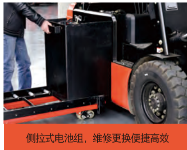
侧拉式电池组，维修更换便捷高效