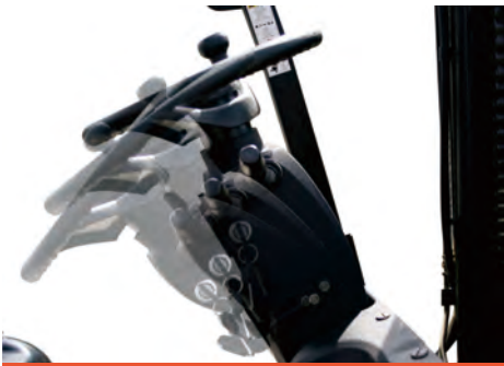
方向盘角度可调, 适用不同身高及驾驶习惯的操作者