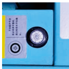
带水平仪,安全有保障